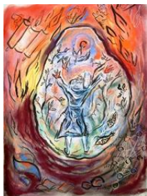
Een rabbijn groet de natuur